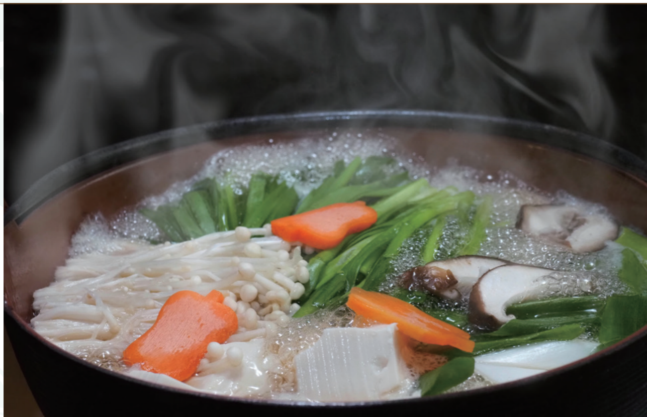
ご主人が研究を重ねてたどり着いた「ちゃんこ鍋」。鍋料理のメニューはこの逸品のみ

下町情緒と新しいスポットが混ざり合った江戸下町「神田」の一度は行ってみたい美味しいお店をご紹介します。