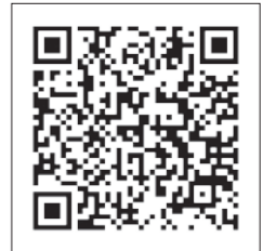
メールアドレス登録フォーム