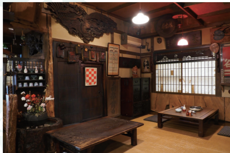
左側の壁の中央に飾られているのは古い番付表。アンティークな調度品がノスタルジックな雰囲気を演出す