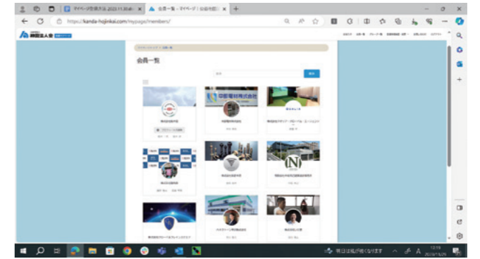
マイページサンプル

神田法人会ホームページで、2024年2月よりマイページ(会員情報)の運用が開始されました。マイページとは、会員が個々にカスタマイズした内容を提供出来るWEBサイト上の会員向け専用ページのことです。会員間の交流、会員企業検索、閲覧、お知らせなど将来的には新しい機能をさらに追加する予定でございます。右記の二次元バーコードを読み取って頂き、会員の情報確認ならびに企業情報の追加やアイコン・画面の更新にご協力をよろしくお願い致します。