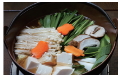
ちゃんこ鍋の具材はハクサイ、長ネギ、シイタケ、ニラ、ニンジン、エノキ、コンニャクとマダイのツミレ。ちゃんこ一筋のご主人が行き着いた組み合わせだ

近くにありましたが、神田明神下界限にはまだ花街の名残があって、よく食事に連れてこられました。この辺の雰囲気が入っていたので、引退後にすぐこの近くでちゃんこ鍋屋を始めたんです」と主人は語る。戦前、今の秋葉原駅から神田明神下にかけて、花街が形成されていた。開発によりその面影は失われてしまったが、最後まで名残があったのが、明神男坂の下の路地「明神下中通り」沿いといわれている。