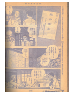
少年マガジンの人気連載「釣りにキチ三平」の1982年5月に掲載された「呪いウキ」の回は、主人公として実名で登場