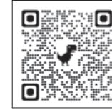
2023年には本社ビルの地下にライブ配信スタジオとセミナーや展示会にも使えるレンタルスペースを増設。詳細はウェブサイト参照

シングを体感すべく自らトーナメントにも参戦。優勝したことも、自分の目で見て楽しんだことで、それまで国内では「ルアー&フライフィッシング」として同じ土俵で語られることが多かったバスフィッシングとフライフィッシングは全くの別物であることを確信。そして1985年、手始めに専門誌「鮎釣り」を創刊。単一種目だけで一冊の雑誌ができることを証明してみせ翌年、バスフィッシング専門誌「Basser」を創刊した。