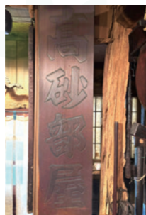
これはご主人が現役時代の部屋の看板