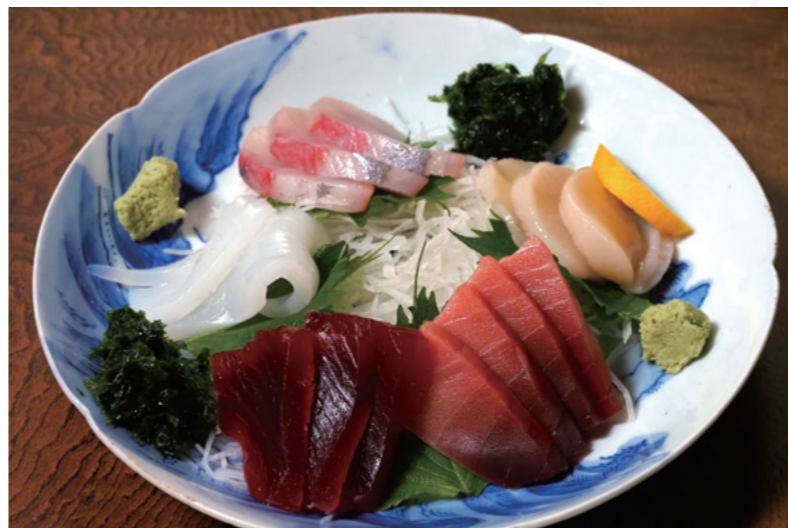
豊洲市場から旬の刺身も毎日入荷している。刺身盛り合わせは1人前4,000円〜

鍋料理は「ちゃんこ鍋」一点のみ。夏場もメインは「ちゃんこ鍋」だという。それで50年以上暖簾を守り続けているのである。具