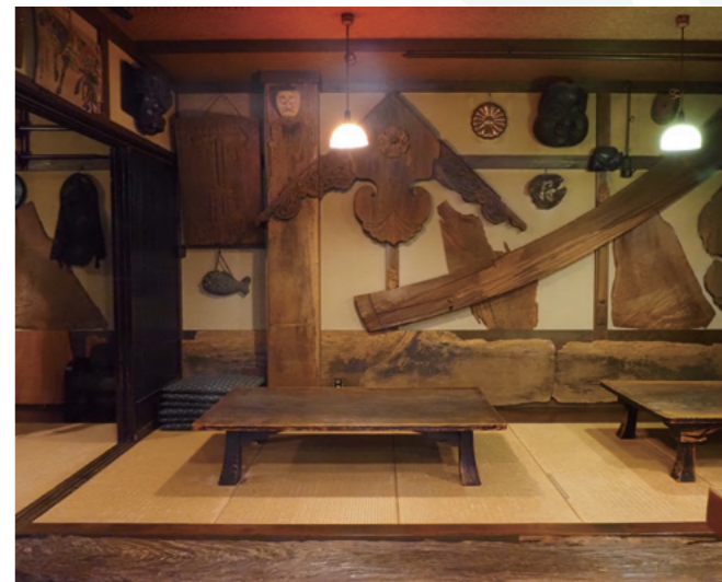
こちらは民芸館を思わせるお座敷