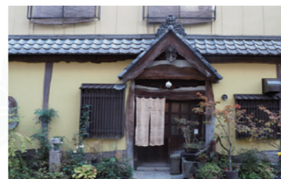
鬼瓦を配した民家風の建物